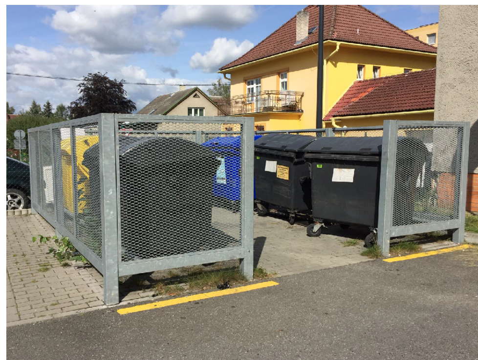
PŘÍKLAD STANOVIŠTĚ V SÍDLIŠTI ROŽNOVSKÁ VE FREŠTÁTU POD RADHOŠTĚM